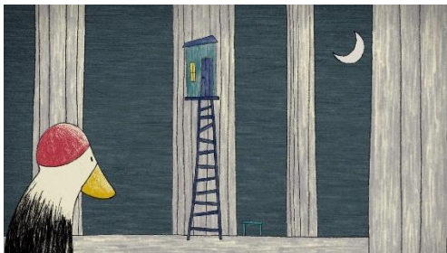
Forsvind Alfred: Flyttefilm

Animationsfilm bliver skabt med meget forskellige værktøjer. I denne filmpakke, kommer I til at opleve nogen af disse teknikker: Klassisk tegnede figurer, computer-udviklede figurer, 2D og 3D figurer eller flyttefilm, hvor udklippede figurer bevæges under kameraet, et eller to billeder ad gangen.