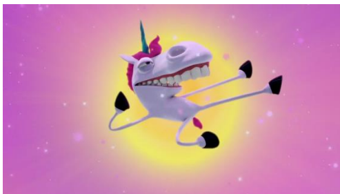
Ztrirer: Computer 3D animation