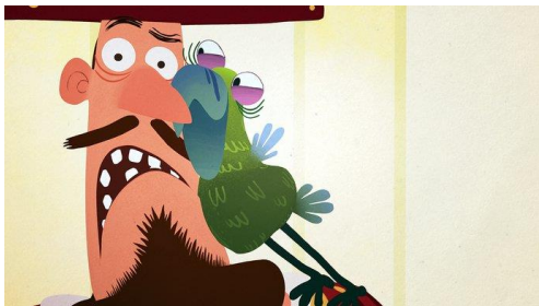
Parrot Away: Klassisk 2D animation