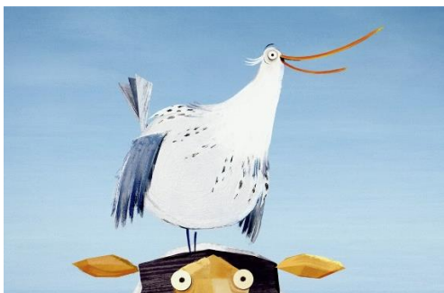
Sabaku: Klassisk 2D animation