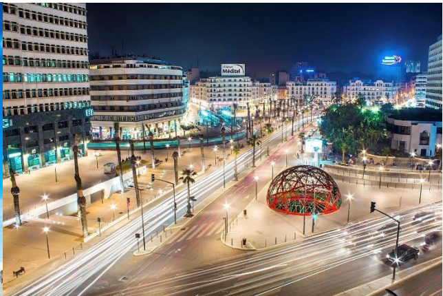
Downtown i det moderne Casablanca.

De to billeder herover illustrerer, hvordan Marokko er et land, der er splittet mellem tradition og modernitet, som det også bliver fremstillet i filmen 'Casablanca Beats'. Hassan II moskeen er bygget i 1993 i traditionel muslimsk arkitektur, mens det moderne downtown i Casablanca, som er Marokkos største by, er bygget i beton, glas og stål som alle moderne storbyer.