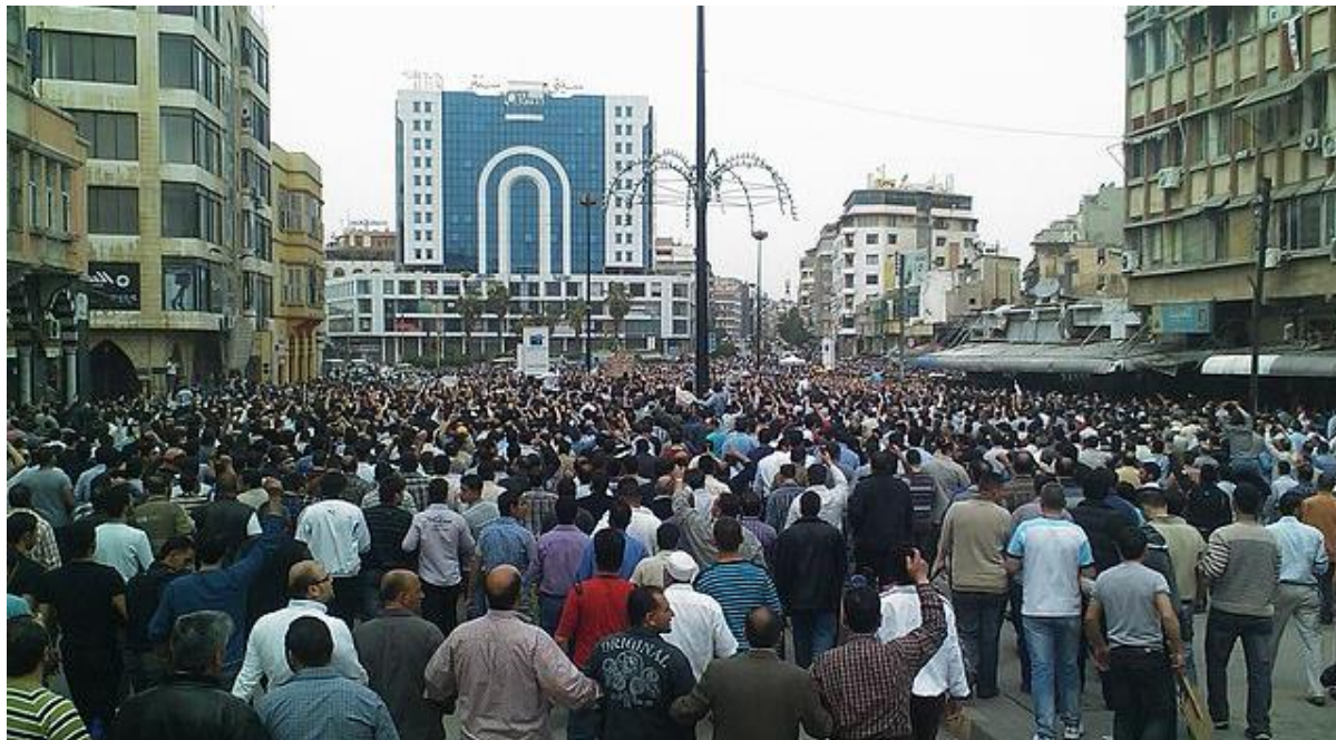
Demonstration mod Bashar al-Assad i Homs, Syrien i 2011.

Formålet med denne opgave er, at I skal undersøge samfundsmæssige problemstillinger og formidle dem, som det står i fællesmålene for Samfundsfag, som I kan se på side 7.