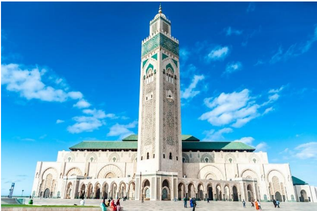
Hassan II moskeen i Casablanca.