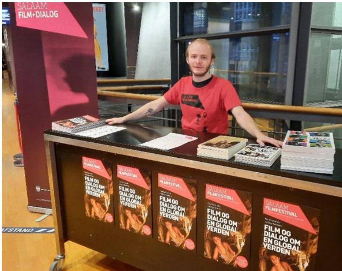
Salaam Filmfestival i Cinemateket i København, Foto Nicolai Perjesi

Med film fra alverdens lande og levende, personlige oplæg tilbyder Salaam et globalt udsyn og øget indsigt i verdens kulturer. Film er en magisk nøgle til kulturel bevidsthed og forståelse, især på grund af filmens evne til at skabe identifikation hos den enkelte. På baggrund af filmoplevelserne skaber vi personlige møder mellem eleverne og vores oplægsholdere, som udfordrer stereotyper og nuancerer holdninger til fællesmenneskelige og eksistentielle temaer.