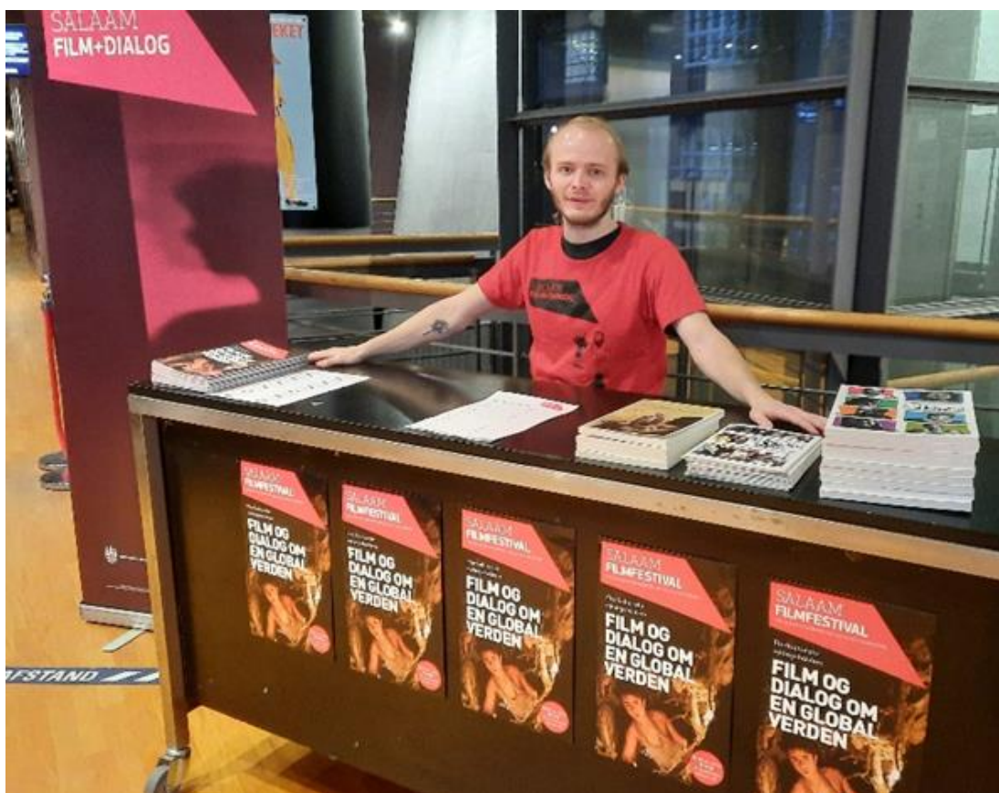
Salaam Filmfestival i Cinemateket i København, Foto Nicolai Perjesi

Med film fra alverdens lande og levende, personlige oplæg tilbyder Salaam et globalt udsyn og øget indsigt i verdens kulturer. Film er en magisk nøgle til kulturel bevidsthed og forståelse, især på grund af filmens evne til at skabe identifikation hos den enkelte. På baggrund af filmoplevelserne skaber vi personlige møder mellem eleverne og vores oplægsholdere, som udfordrer stereotyper og nuancerer holdninger til fællesmenneskelige og eksistentielle temaer.