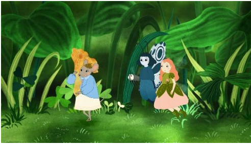
Teknik: Klassisk håndtegnet animation