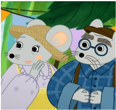
Hr. og fru mus