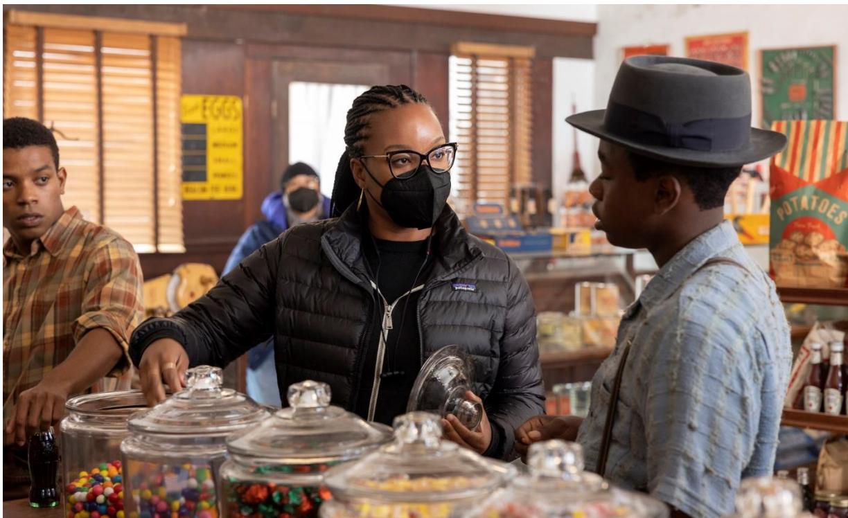
Filminstruktøren Chinonye Chukwu instruerer spillefilmens Emmett Till. Pressefoto.

I denne opgave skal I sammenligne en dokumentarfilm om mordet på Emmett Till med den dramatiserede film, I har set 'Retfærdighed for Emmett Till'. Formålet er at I kan 'vurdere filmproduktioner i et kulturelt perspektiv', som der står i fællesmålene for faget filmkundskab. I kan se mere om fællesmålene på side 7.