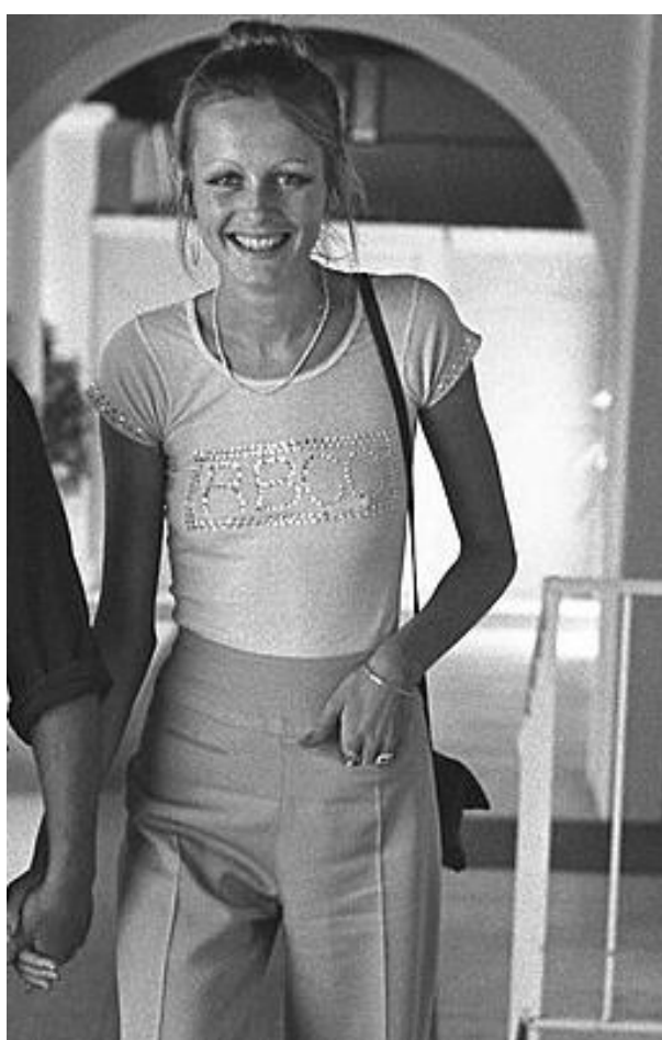
Marilyn Monroe 1953 og Twiggy 1973.

Det er sundt at være glad for sin krop, og en krop kan have mange former, som ikke altid passer ind i tidens ideal. Og tidens ideal ændrer sig. Tidligere var normen, at en kvinde med runde former som Marilyn Monroe var smuk, men det ændrede sig fx i 1960'erne, hvor den sygeligt tynde model Twiggy var meget populær.