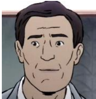
Storebror i Sverige