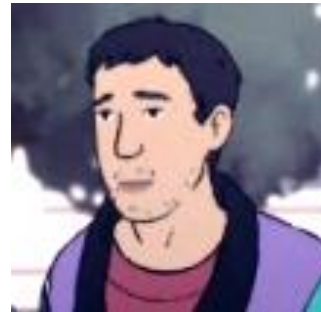
Storebror i Moskva